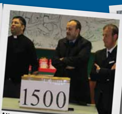
Attraverso le parrocchie consegnati 1500 pacchi alimentari a famiglie con difficoltà.