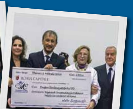
Raccolta fondi per il reparto di Oncologia Pediatrica - Umberto I, alla presenza di Gianni Letta.