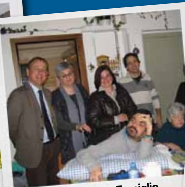
Impegno nelle Case Famiglia.