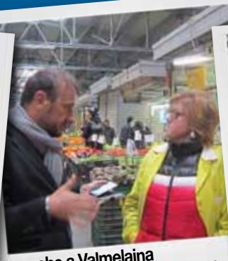
...anche a Valmelaina a contatto con i commercianti