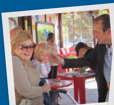
Incontri con famiglie, donne e anziani.

" CONTINUERÒ A DEVOLVERE IL MIO COMPENSO DI CONSIGLIERE A FAVORE DI FAMIGLIE E PERSONE PIÙ BISOGNOSE! "